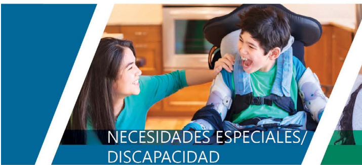
NECESIDADES ESPECIALES/ DISCAPACIDAD