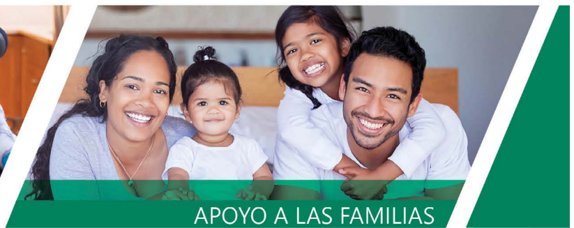
APOYO A LAS FAMILIAS

Dakota County Public Health Department 651.554.6100 www.dakotacounty.us