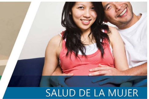
SALUD DE LA MUJER