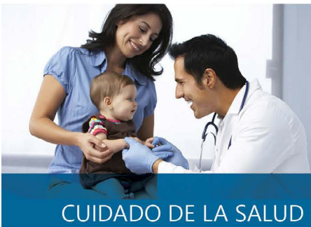
CUIDADO DE LA SALUD

Para niños y familias en el condado de Dakota